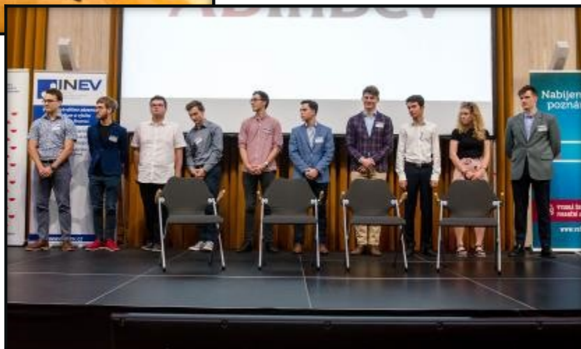
Desítka nejlepších finalistů Ekonomické olympiády