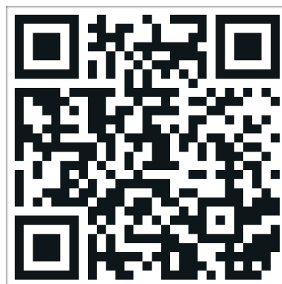
Odkaz na video z finále v ČNB